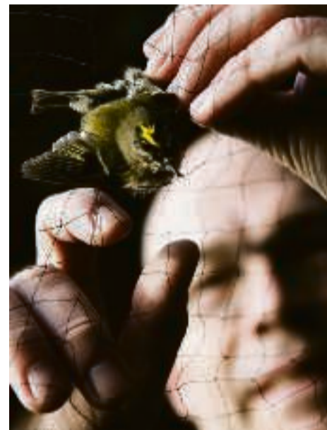
Danmarks mindste fugl, en fuglekonge på bare fem gram, er gået i Henrik Knudsens net. Den er sandsynligvis kort forinden fløjet hele vejen over Nordsøen fra sin overvintring i England.